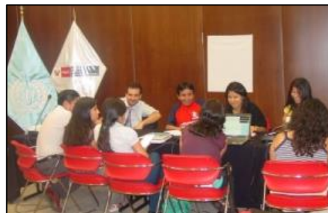
Taller tripartito “Diálogo Nacional Juvenil” -