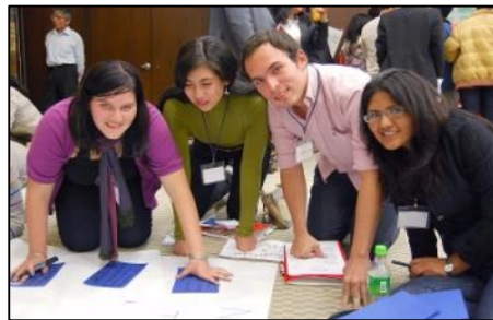
I Foro “Juventud, Empleo y Migración” - 2010 2011