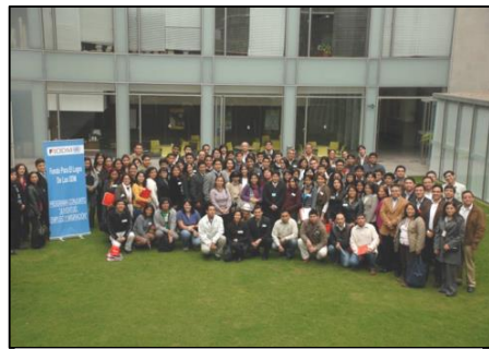
II Foro Nacional Sobre Juventud, Empleo