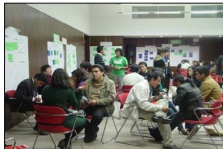
Taller tripartito “Diálogo Nacional Juvenil” - 2011